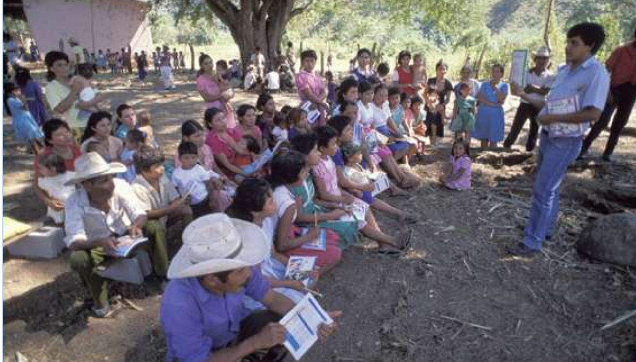
Honduras: Programa de alfabetización rural