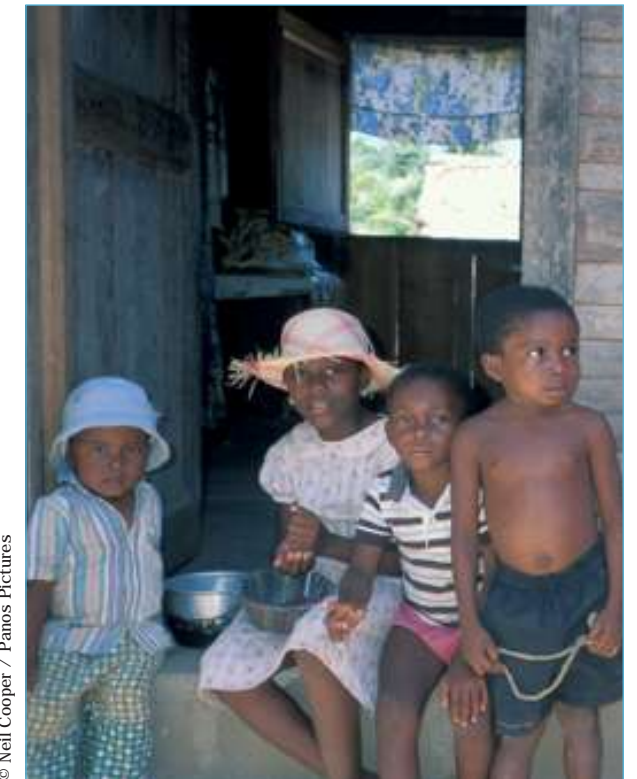
© Neil Cooper / Panos Pictures

DFID fue uno de los primeros organismos internacionales que empezó a trabajar en temas raciales en Brasil, cuando aún no eran reconocidos como un problema por el gobierno brasileño. DFID facilitó un acercamiento entre el movimiento negro y personas del gobierno y el sector privado que pensaban de manera similar, para estimular el trabajo en temas raciales. Demostramos la importancia de este tema al Banco Mundial a través de nuestro apoyo para discusiones conjuntas entre el movimiento negro y funcionarios claves del Banco Mundial. Complementamos estas acciones con estudios del contexto racial que contribuyeron al diseño de un nuevo proyecto de salud del Banco Mundial. Al mejorar la información que respaldó el diseño del proyecto, DFID pudo asegurar que las necesidades de la población negra fueran atendidas de manera efectiva.