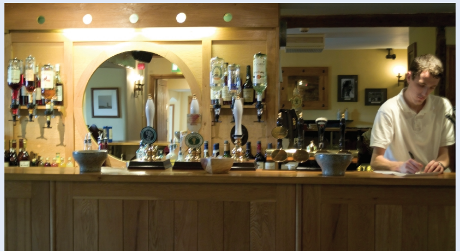
Mae mwy o wybodaeth am drwyddedau personol ar gael yn Adran 6 o'r Ddeddf, Rhan 3 o Atodlen 8 y Ddeddf a Rhan 4 o'r Canllawiau.

A. Gall unigolyn nad yw'n deiliad trwydded ynadol wneud cais am drwydded bersonol yn unol â darpariaethau Adran 6 o'r Ddeddf. Mae unrhyw drwydded bersonol sy'n cael ei rhoi yn dod i rym yn syth. Er hynny, nid oes unrhyw rym ymarferol i awdurdod yn sgil y drwydded tan yr ail ddiwrnod penodedig pan fydd trwyddedai mangre yn dod i rym a darpariaethau'r Ddeddf wedi'u gweithredu'n llawn.